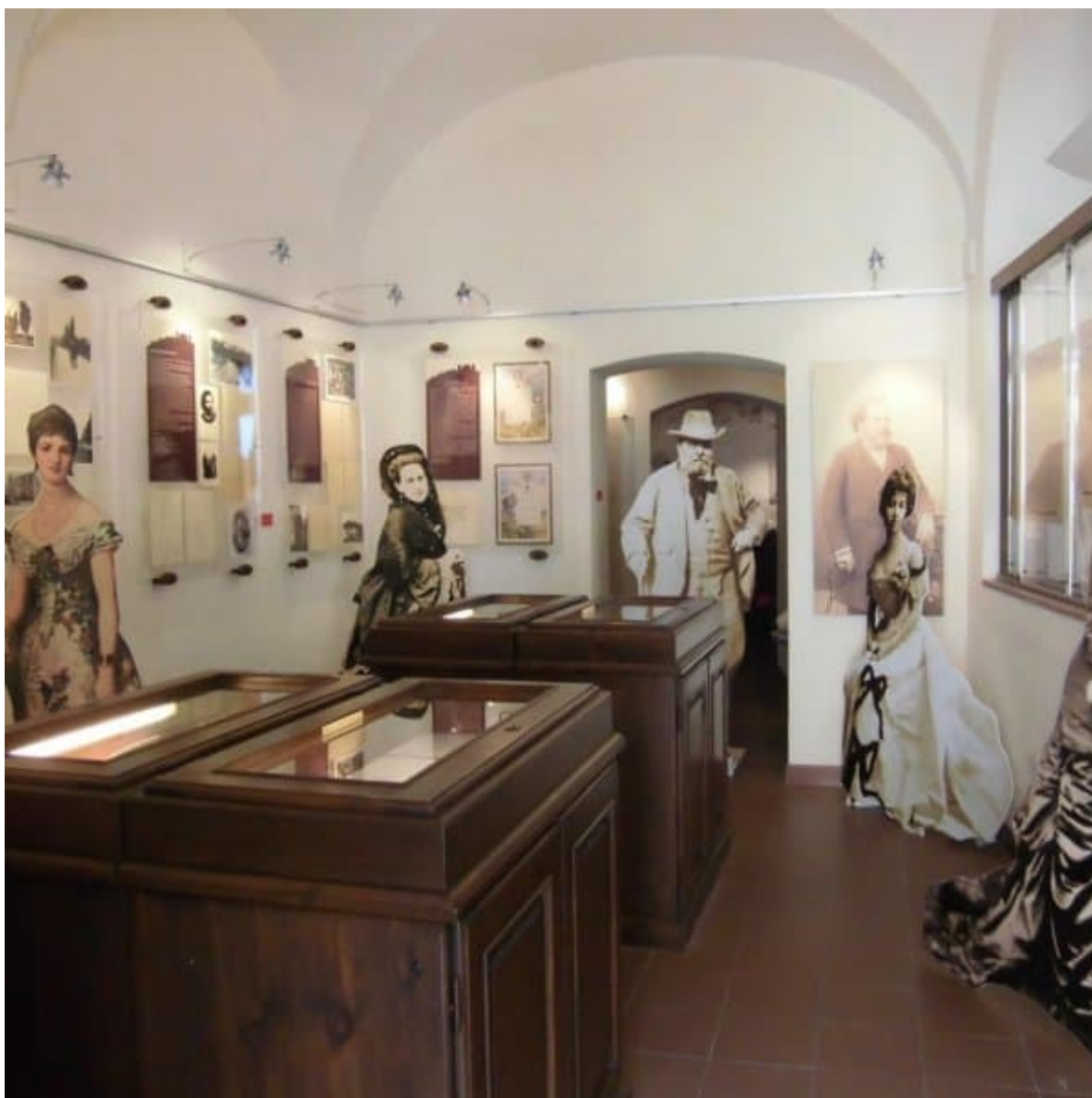
Parco letterario Giosuè Carducci – Credits: