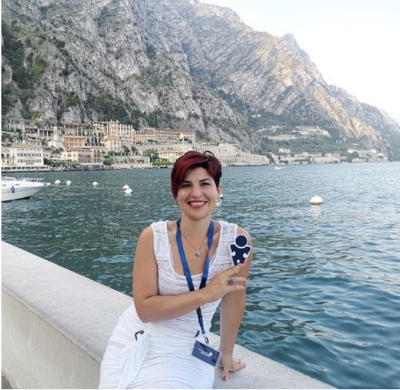
Lara di Puzzle di Bordo

Puzzle di Bordo è un nuovo progetto turistico Italiano realizzato per promuovere le relazioni tra Viaggiatori, Professionisti Turistici, Strutture Ricettive e Associazioni.