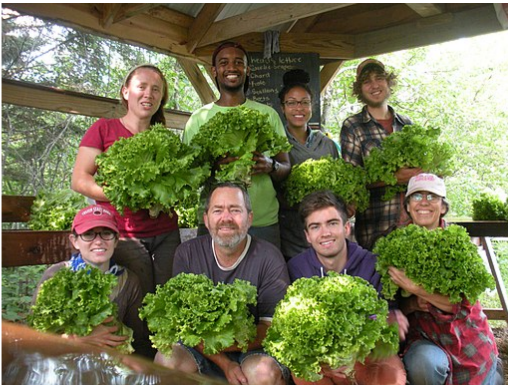
WWOOF negli Stati Uniti

Si tratta di una forma di volontariato: vitto e alloggio in cambio di lavoro