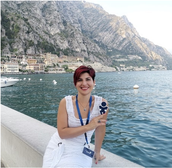
Lara di Puzzle di Bordo

Puzzle di Bordo è un nuovo progetto turistico Italiano realizzato per promuovere le relazioni tra Viaggiatori, Professionisti Turistici, Strutture Ricettive e Associazioni.